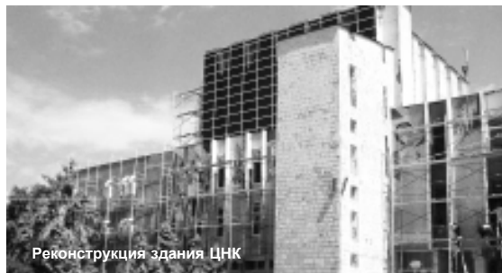
Реконструкция здания ЦНК

- Ежедневно по четвергам в населенных пунктах района проводится прием граждан в рамках "Единого социального окна".