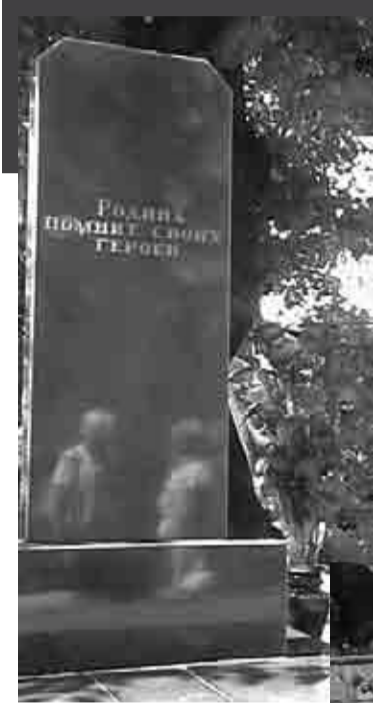
Помните! Через века, через года, – помните! О тех, кто уже не придет никогда, – помните!

На фоне звука метронома и залпов стрелкового оружия минутой молчания почтили